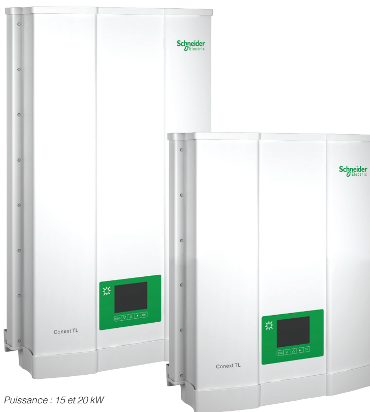
Puissance : 15 et 20 kW